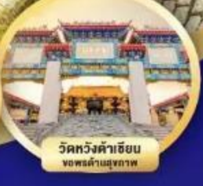
วัดหวังต้าเซียน ขอพรด้านสุขภาพ