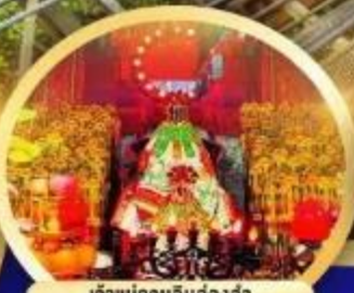
เจ้าแม่กวนอิมองค์อ่า นับถวายเป็นสิริมงคลที่เมืองกว่า 600 ปี