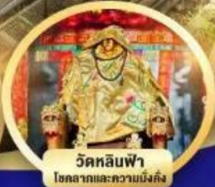
วัดหลินฟ้า โชคลาภและความมั่งคั่ง