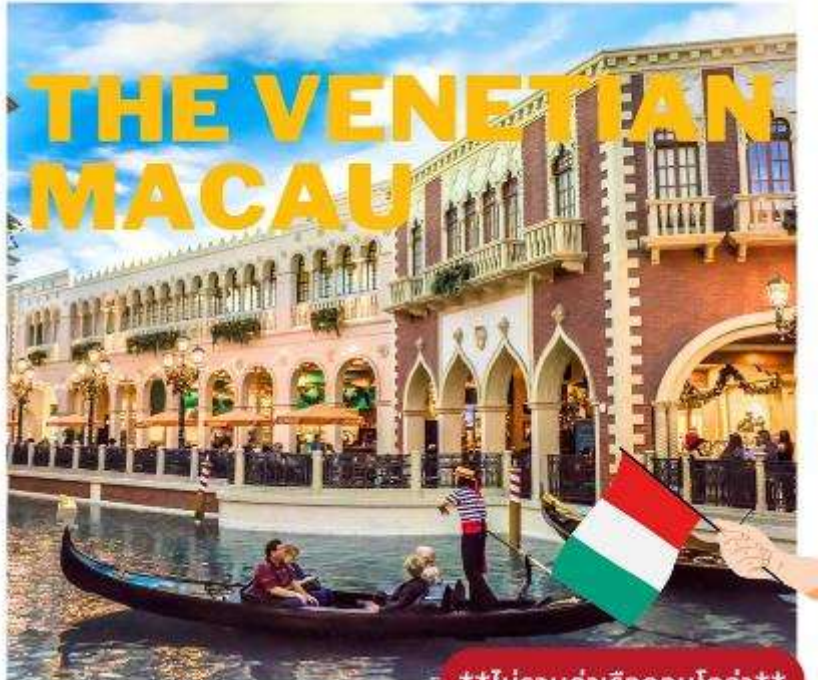
เดอะ เวเนเชียน มาเก๊า