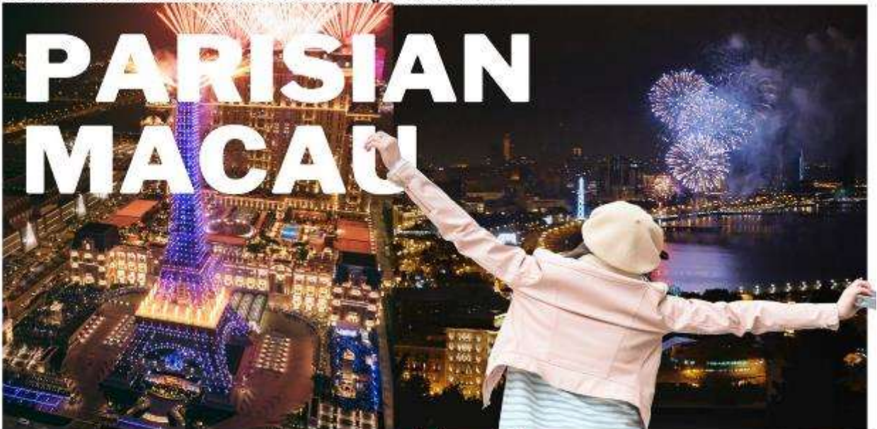
เดอะปารีสเซียน มาเก๊า

นำท่านชมความสวยงามของลาสเวกัสเอเชีย ภายในพร้อมสรรพด้วยสิ่งอำนวยความสะดวก ที่ให้ความบันเทิงและสถานที่ช้อปปิ้งต่างๆ ท่านจะพบกับร้านค้าแบรนด์เนมชื่อดังมากมายกว่า 350 ร้าน และภัตตาคารต่างๆ ให้ท่านสัมผัสกับบรรยากาศการล่องเรือเวนิสที่อิตาลี สถาปัตยกรรมเวนิสที่คลาสสิก สีสันสดใส เดอะแกรนด์คานาเล่ช้อปปิ้งที่ตั้งอยู่ใจกลางโรงแรม