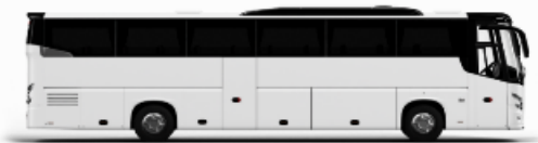
ตัวอย่างรถทัวร์ 1 ชั้น

หากประเภทห้องที่ท่านริเคอสมามีเต็มจาก เช่น ริเคอสห้องพักเป็น TWIN BED หรือ DOUBLE BED ทางบริษัทขอสงวนสิทธิ์ในการปรับประเภทห้องพัก เป็นตามที่มีโรงแรมอยู่ โดยไม่ต้องแจ้งให้ทราบล่วงหน้า