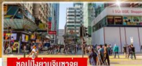
ชอปปิงยานจิมซาจุย