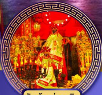
วัดเจ้าแม่กวนอิม ฮองฮำ