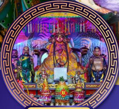
ศาลเจ้าหั่งเจีย