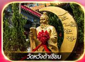
วัดหวงต้าเซียน