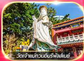
วัดเจ้าแม่กวนอิมพรอสเปอ