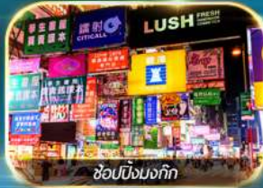
ช้อปปิ้งมงก๊ก

เต็มอิ่มทั้งบุญ และ ช้อปปิ้งแบบจัดเต็ม จิมซาจุ้ย มงก๊ก