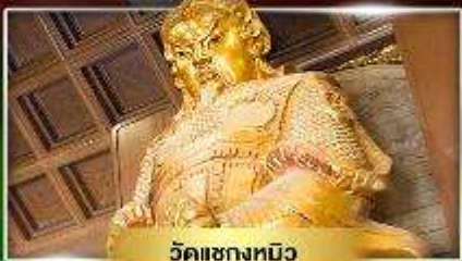
วัดเขกหมิว

หมั่นก้มหน้าขอวัดแซก ยี่มั้ง "เจ้ากวนอิมฮ่องฮ่า"