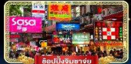
ช้อปปิ้งจิมซาจู้