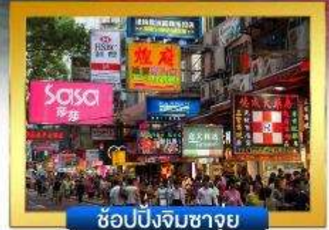
ช้อปปิ้งจิมซาจู้