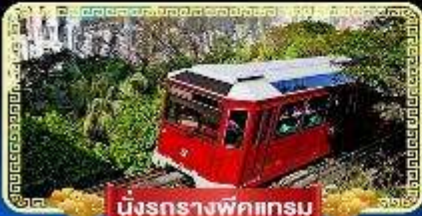
นั่งรถรางพิกเกรม

🇭🇰 นิงกระเซ่านองปิง 360 องศา บินลัดฟ้าไปมู..สู่เกาะฮ่องกง