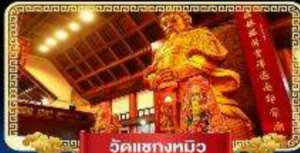
วัดเขangkหมิว