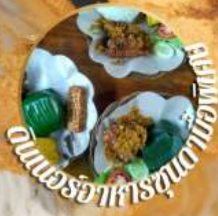
อาหารอร่อยตาม ประเพณี