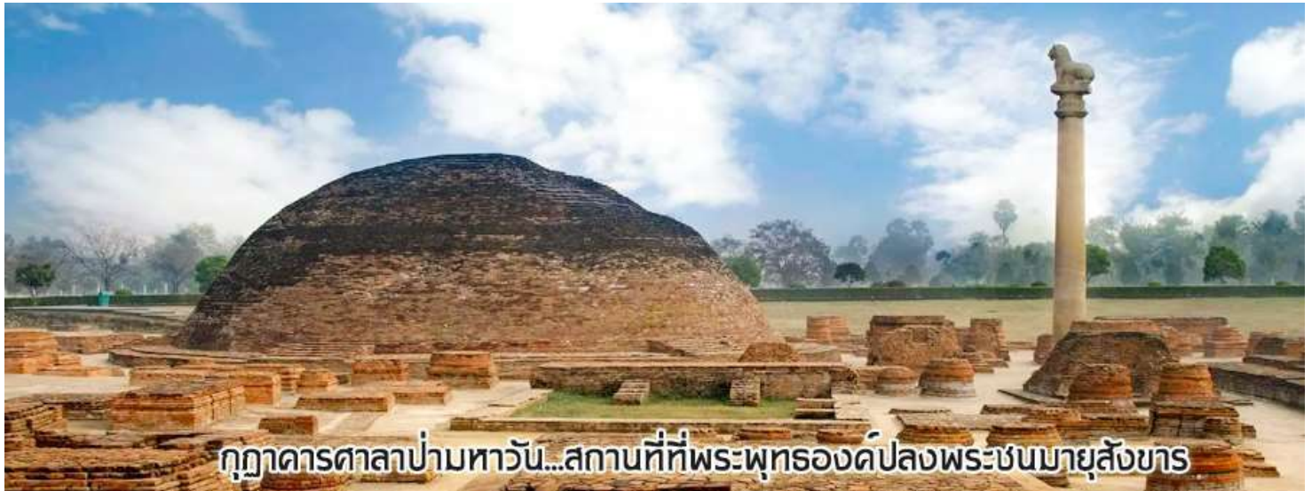
กุฎาคารศาลาป่ามหารวัน...สถานที่ที่พระพุทธองค์ปลงพระชนมายุสังขาร

นำท่านเดินทางต่อสู่เมือง กุสินารา (เดินทางประมาณ 4 ชั่วโมง)เมื่อถึงกุสินาราแล้วเดินทางไป วัดไทยกุสินาราเฉลิมราชย์ วัดนี้สร้างขึ้นเพื่อน้อมเป็นพุทธบูชาและเฉลิมพระเกียรติพระบาทสมเด็จพระเจ้าอยู่หัวในวาระครองสิริราชสมบัติครบ 50 ปี และเฉลิมพระชนมพรรษาครบ 6 รอบ 72 พรรษา พระบาทสมเด็จพระเจ้าอยู่หัวพระราชทานชื่อวัดให้ เชิญท่านร่วมทำบุญตามกำลังศรัทธา