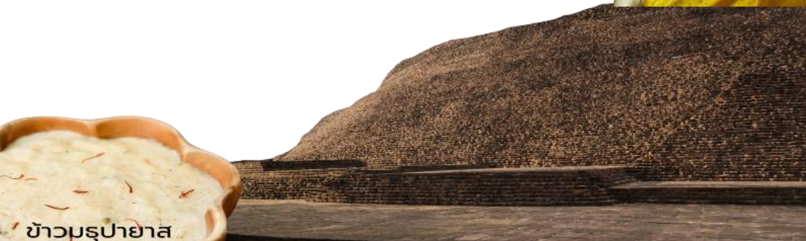
ข้าวมธุปายาส