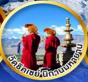
วัดธิคเซย์ตีกวานบเทยาน