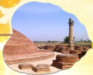
เมืองหลวงแคว้นอานาจักรวัชชี แคว้นชมพูทวีป