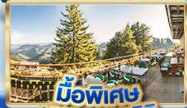
มือพิเศษ บียอดเจริญ