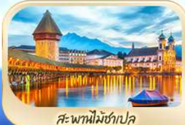
สะพานไมซ์าป