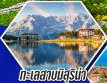
ทะเลสาบมิสุร์น่า