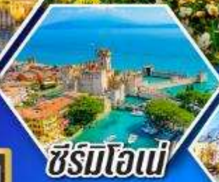
ซีร์มิโอเน่