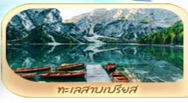
ทะเลสาบเปรียงส์