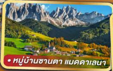
• หมู่บ้านซานตา แมดดาเลนา