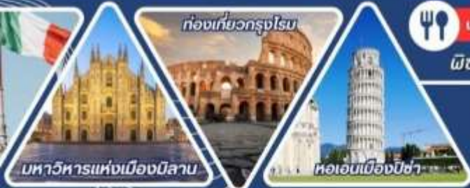
มหาวิหารแห่งเมืองมิลาน

✓ นั่งรถไฟเที่ยวซิงเควเทอร์ เที่ยวเกาะเวนิส หอเอนพิซ่า ใน 7 สิ่งมหัศจรรย์