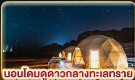
นอนโดมคูดาวกลางทะเลทราย

บินตรงสู่ “จอร์แดน” เยือน 7 มหัศจรรย์ของโลก