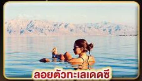
ลอยตัวทะเลเดคซี