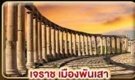
เอรราช เมืองพันเสา