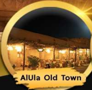
AIUla Old Town