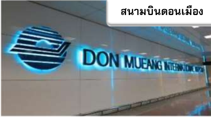
สนามบินดอนเมือง

เวลา 22.30 น. พร้อมกันที่ ท่าอากาศยานดอนเมือง อาคารผู้โดยสารขาออกระหว่างประเทศ เคาน์เตอร์สายการบินไทยแอร์เอเชีย เจ้าหน้าที่คอยให้การต้อนรับ ดูแลด้านเอกสาร เช็คอิน และสัมภาระในการเดินทาง