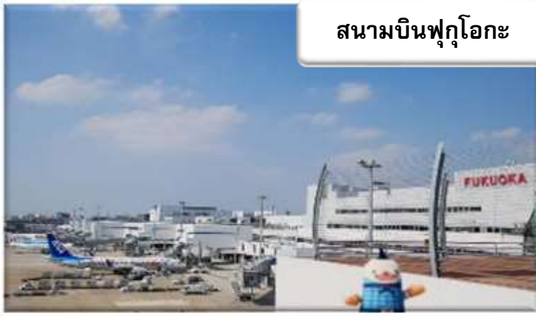
สนามบินฟุกุโอกะ

เวลา 01.45 น. ออกเดินทางสู่ สนามบินฟุกุโอกะ ประเทศญี่ปุ่น โดยสายการบินไทยแอร์เอเชีย เที่ยวบินที่ FD 236