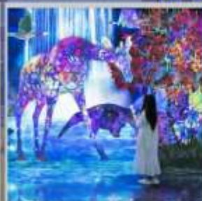
"TEAM LAB FOREST"