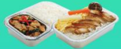
บริการอาหารร้อนบนเครื่องบิน มาไป - ชากลับ