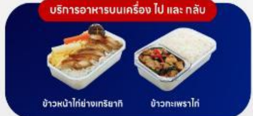
บริการอาหารบนเครื่อง ไป และ กลับ