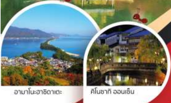
อามาโนะฮาชิดาเตะ