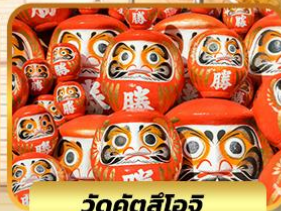
วัดคิตสึโองิ