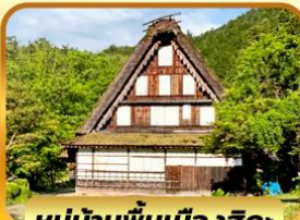
หมู่บ้านพื้นเมืองฮิดะ