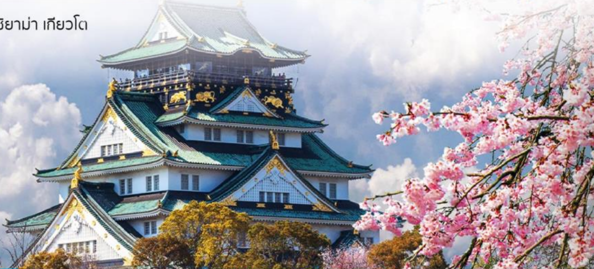
วัดคิโยมิจิ