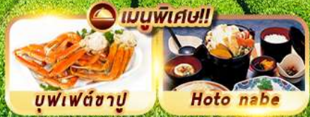
บุฟเฟ่ต์ซาปู