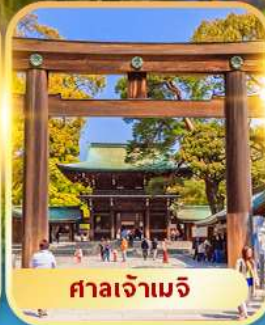
ศาลเจ้าเมจิ