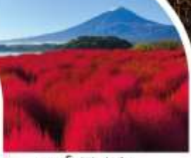
สวนโอบิชิ ปาร์ค