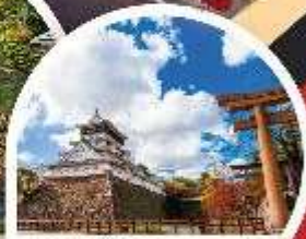
ปราสาทโคคุระ