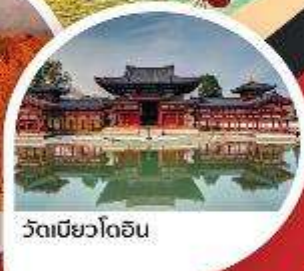
วัดเมียวโดอิน