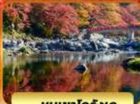
หุบเขาโคริงเค