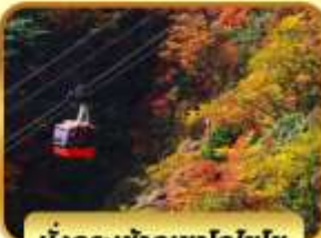
นั่งกระเช้าภูเขาโทโฮไซ