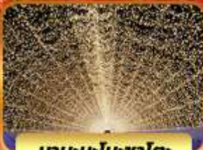
บาระบะโนะซาโตะ