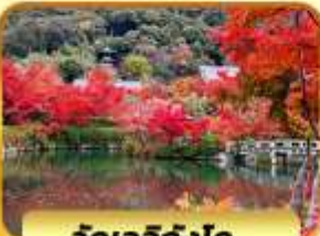
วัดเออิทังโด