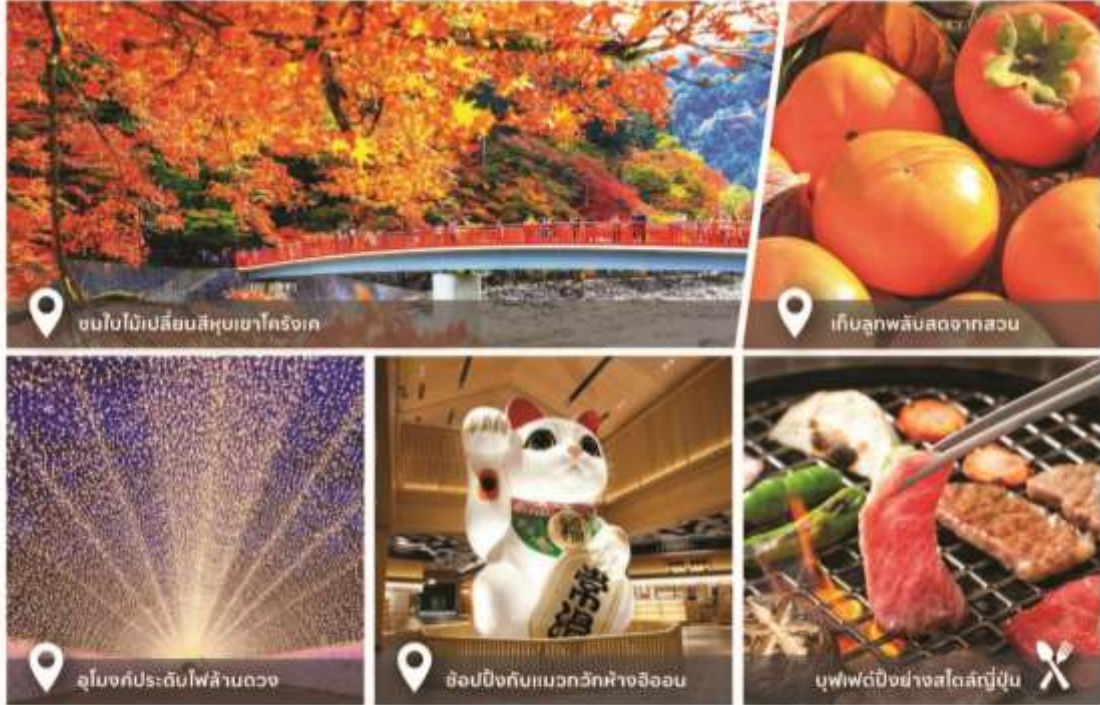
ชมใบไม้เปลี่ยนสีหุบเขาโคริงเค