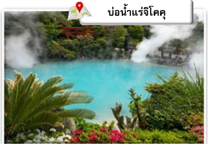
บ่อน้ำแร่จิโคคุ

เดินทางสู่ บ่อน้ำพุร้อน (Jigoku Meguri) หรือ บ่อน้ำพุร้อนขุมนรกทั้งแปด เป็นบ่อน้ำพุร้อนธรรมชาติที่เกิดขึ้นภายหลังจากการระเบิดของภูเขาไฟ ประกอบไปด้วยแร่ธาตุที่เข้มข้น เช่น กำมะถัน แร่เหล็ก โซเดียม คาร์บอเนต เรเดียม เป็นต้น และร้อนเกินกว่าจะลงไปอาบได้ แล้วบ่อทั้ง 8 บ่อ ก็ตั้งชื่อให้แปลกตามลักษณะภายนอกที่เห็นกัน