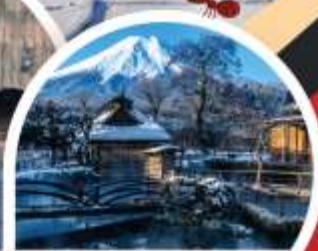
หมู่บ้านโอชิโนะฮักโก

📶 Wifi on bus 🚰 บริการน้ำดื่ม 👤 10 คน ออกเดินทาง