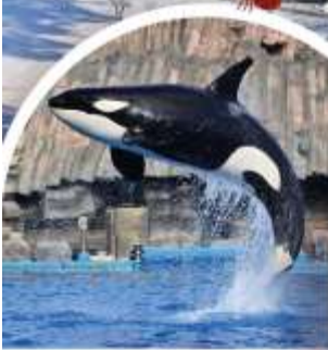
พิพิธภัณฑ์สัตว์น้ำท่าเรือนาโงย่า