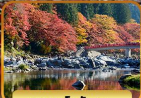
หุบเขาโครังเค