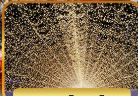
น้ำพุร้อนโนะซาทะ