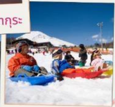
ลานสกีเยติ