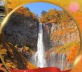
น้ำตกเคกอน