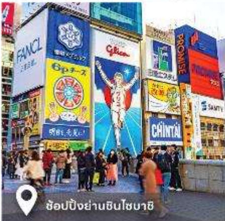
📍 ช้อปปิ้งย่านชินโซบาชิ