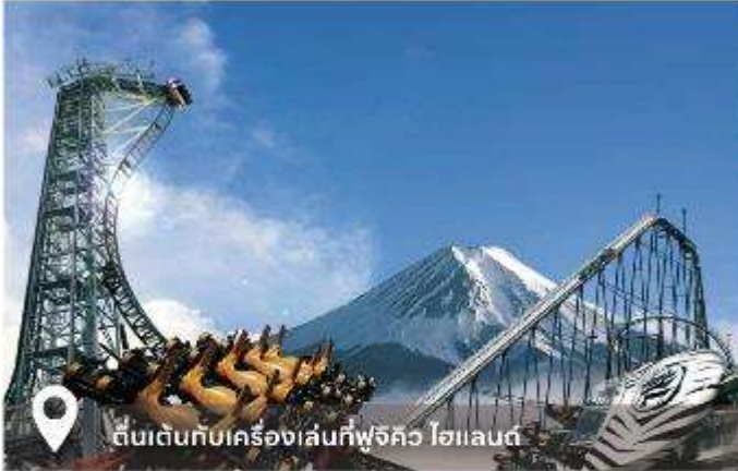
📍 ตื่นเต้นกับเครื่องเล่นที่ฟูจิคว ไซแลนด์

🌐 www.buddytriptravel.com 📱 buddytriptravels 📧 @buddytriptravel