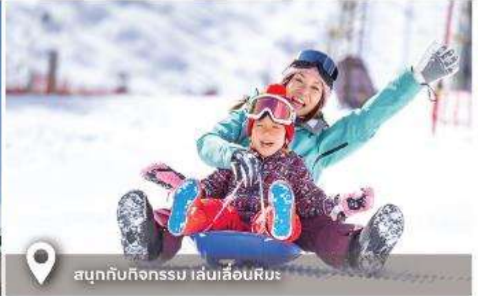
📍 สนุกกับกิจกรรม เล่นเลื่อนหิมะ