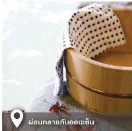
📍 ผ่อนคลายกับออนเซ็น