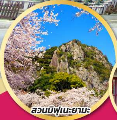
สวนมิฟูเนะยามะ