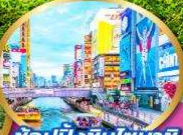
ช้อปปิ้งชินไซบาชิ