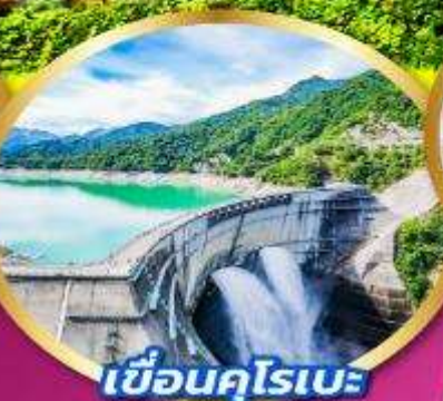
เขื่อนคุโรเบะ