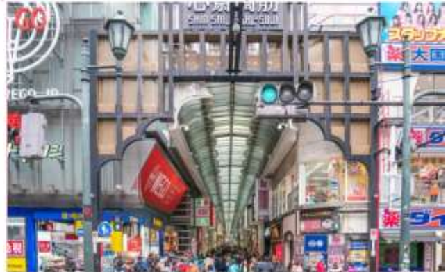
อิสระอาหารกลางวันตามอัธยาศัย (ไม่รวมในรายการ)