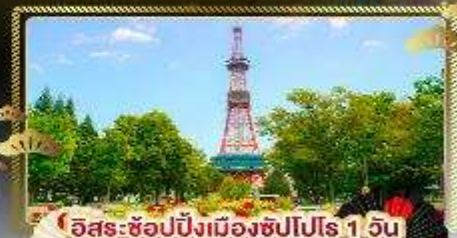
อิสระ-ช้อปปิ้งเมืองซัปโปโร 1 วัน