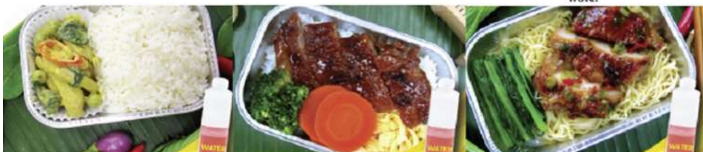
Chicken roasted with herb and noodle and water