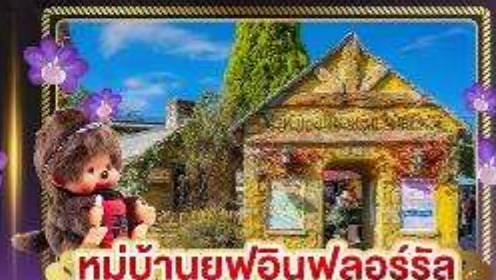
หมู่บ้านยูฟูอินฟลอร์ริล