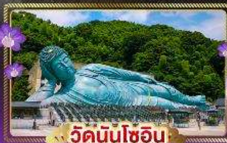
วัดนินโซอิน