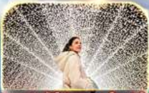
ชมงานประดับไฟนาฮานา ในะ ซาโตะ