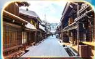
เมืองเก่าชินมาชิซูจิ