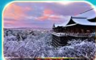
วัดคิโยมิตสึ