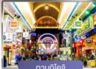
ทานุกิโคจิ