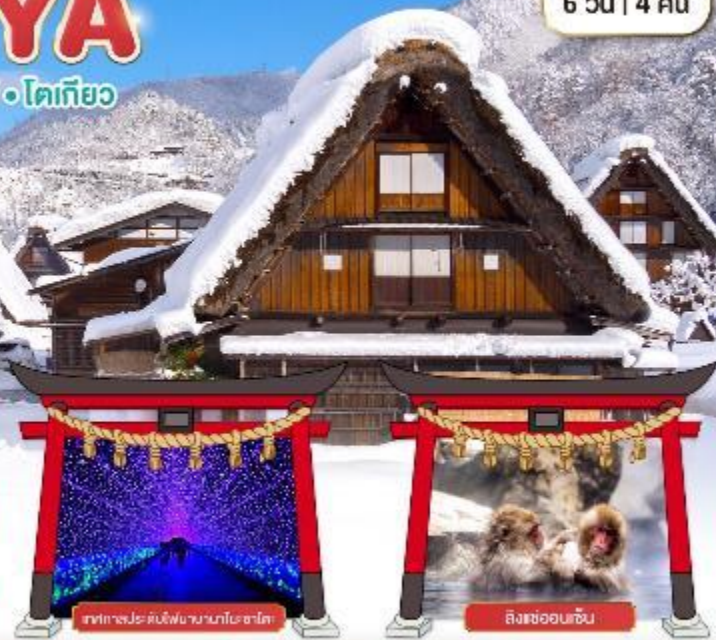
เทศกาลประดับไฟนากาโนะ ซาโตะ