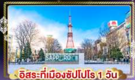
อิสระที่เมืองซัปโปโร 1 วัน