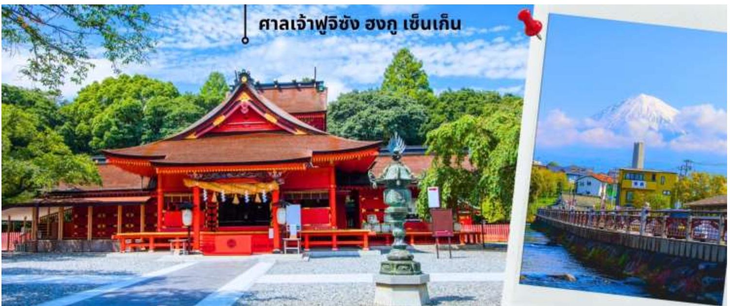
ศาลเจ้าฟูจิซัง ฮงกุ เซ็นเก็น

จากนั้นนำท่านไปสักการะ ศาลเจ้าฟูจิซัง ฮงกุ เซ็นเก็น ไทฉะ (Fujisan Hongu Sengen Taisha) ศาลเจ้าอายุเก่าแก่กว่า 1,000 ปี สร้างขึ้นเพื่อเป็นการบวงสรวงเทพเจ้าของภูเขา เพื่อให้หยุดการปะทุของภูเขาไฟฟูจิในช่วงที่มีการระเบิด ถือเป็นศาลเจ้าที่สำคัญที่สุดของภูมิภาค นอกจากนี้ศาลเจ้าฟูจิซัง ฮงกุ เซ็นเก็น ไทฉะ ยังเป็นส่วนหนึ่งของมรดกโลกทางวัฒนธรรมภูเขาฟูจิ