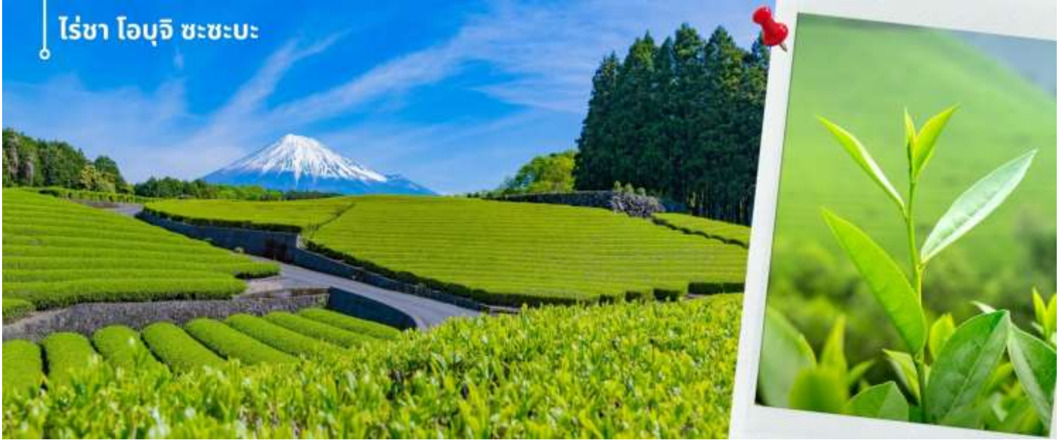
ไร่ชา โอบุจิ ซะซะบะ

หลังรับประทานอาหารเที่ยง นำท่านเดินทางสัมผัสบรรยากาศไร่ชาสไตล์ญี่ปุ่น “มัทฉะ (Matcha)” เป็นรสชาติที่ได้รับความนิยม มีต้นกำเนิดอยู่ในญี่ปุ่น ผลิตขึ้นจากชาเขียวหรือที่เรียกว่า “เรียวกุฉะ (Ryokucha)” และสถานที่ซึ่งเป็นแหล่งผลิตชาเขียวที่มีชื่อเสียงแห่งหนึ่งในญี่ปุ่น ไร่ชาโอบุจิ ซะซะบะ (Obuchu Sasaba) ตั้งอยู่ใกล้กับภูเขาไฟฟูจิ ในจังหวัดชิซุโอกะ (Shizuoka) ที่รู้จักกันดีว่าเป็นภูมิภาคที่มีการผลิตชาชั้นนำของประเทศญี่ปุ่น ไร่ชาแห่งนี้โดดเด่นในเรื่องของวิวทิวทัศน์ที่สวยงาม ในวันที่ฟ้าเปิด จะสามารถมองเห็นภูเขาไฟฟูจิได้อีกด้วย บรรยากาศที่สวยงามกับไร่ชาสีเขียวพร้อมกับพื้นหลังเป็นภูเขาไฟฟูจิ ให้ท่านได้อิสระเก็บภาพบรรยากาศภายในไร่ชา ตามอัธยาศัย