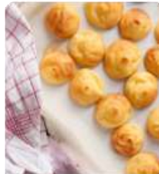
ร้าน KITAKARO ยังมีขนมอบจากเตาอบๆ ใหม่ๆ ให้ลองชิมลิ้มรสกันเลยทีเดียว และเหมาะที่จะซื้อของฝากเป็นอย่างดี